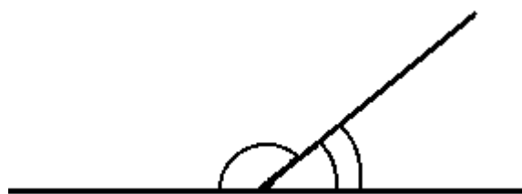
5 - rasm

Oshkor ta'riflarning to'g'riligini baholash uchun tushunchalarni ta'riflash qoidasini bilish zarur. Hammadan oldin ta'riflanuvchi va ta'riflovchi tushunchalar o'lchovdosh (mutanosib) bo'lishi zarur.